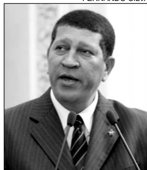
EVENTO - 33 anos

da, na Boa Vista. Hoje, a comemoração será no Clube Alemão, a partir das 22h, na Estrada do Encanamento.