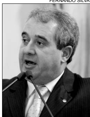
AUGUSTO - Mais trabalho

"Lamentavelmente, esta é uma situação que tem se perpetuado nos últimos anos, com indiscutíveis prejuízos econômicos e sociais para a população", enfatizou o líder do PFL. O setor da constru-