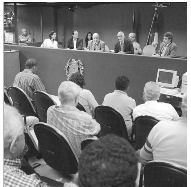
IPEM - Presidente do instituto prestou esclarecimentos