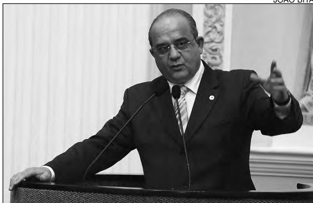
LESSA – Novo investimento da Gerdau traz otimismo

“O governador define metas e as cumpre. Prova disso, são as obras para a