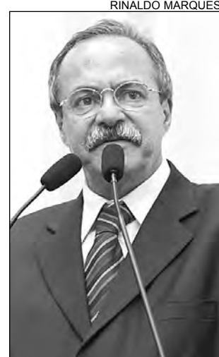
EURICO - Acordo de paz

Existem acusados que estão há dez anos com a prisão preventiva decretada sem julgamento, segundo o tucano. O parlamentar, juntamente, com lideranças políticas e advogados de Belém de São Francisco, de Cabrobó e de Floresta, repassaram