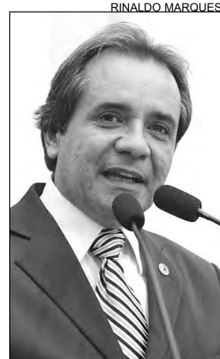
DIVERGÊNCIA - Santana

Santana complementou ser favorável a iniciativas que visem ao desenvolvimento econômico, desde que sejam atreladas a projetos estruturadores, o que, segundo ele, não é o caso. “É preciso que os poderes constituídos fiquem atentos ao que está