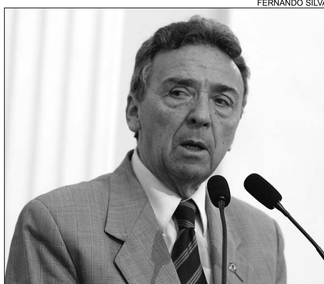
ATUAÇÃO - José Queiroz citou trajetória de Leonel Brizola

Queiroz também lembrou a importância do ex-governador do Rio de Janeiro Leonel Brizola na formação do PDT. "O compromisso com o trabalho e a construção de propostas que a sociedade acredita são legados do grande homem que foi Leonel Brizola".