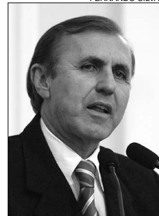
DADO - 40 mil compradores

Sessenta empresas montaram estandes no Festival do Jeans e ocupam 6.000 metros quadrados de área do Parque das Feiras. De acordo com o deputado, o evento pretende consolidar Toritama como produtora de alto padrão e com vocação para agradar o consumidor. "Este ano, a novidade é a Feira da Pronta Entrega, que visa atender diretamente o cliente, tanto no atacado como no varejo", acrescentou. A feira é promovida pela Associação Comercial e Industrial de Toritama (Acit), com apoio do Governo do Estado, Federação das Indústrias do Estado de Pernambuco (Fiepe), Caixa Econômica Federal, Chesf, Sebrae, Canatiba Têxtil e Santana Têxtil.