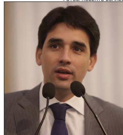
EXPECTATIVA - Deputados esperam que haja uma negociação entre o Executivo e os servidores

rial mais um aumento de 25%, o que não é verdade. Pedimos apenas a reposição de 18,53%, podendo chegar a 25%. Também tentou colocar uma categoria contra a outra, afirmando que, se desse reajuste aos militares, não poderia pagar a professores e médicos”, relatou. “Isso colocou lenha na fogueira. E agora, grande parte da tropa só fala em greve dentro dos quartéis.”