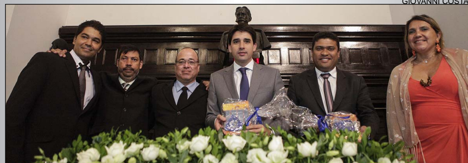
SOLEINIDADE - Durante a cerimônia, foi lançado o livro “O Hagadá do Pêssach do Sertão”