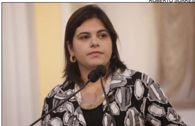
CONVITE - Deputada requereu convocação de secretários