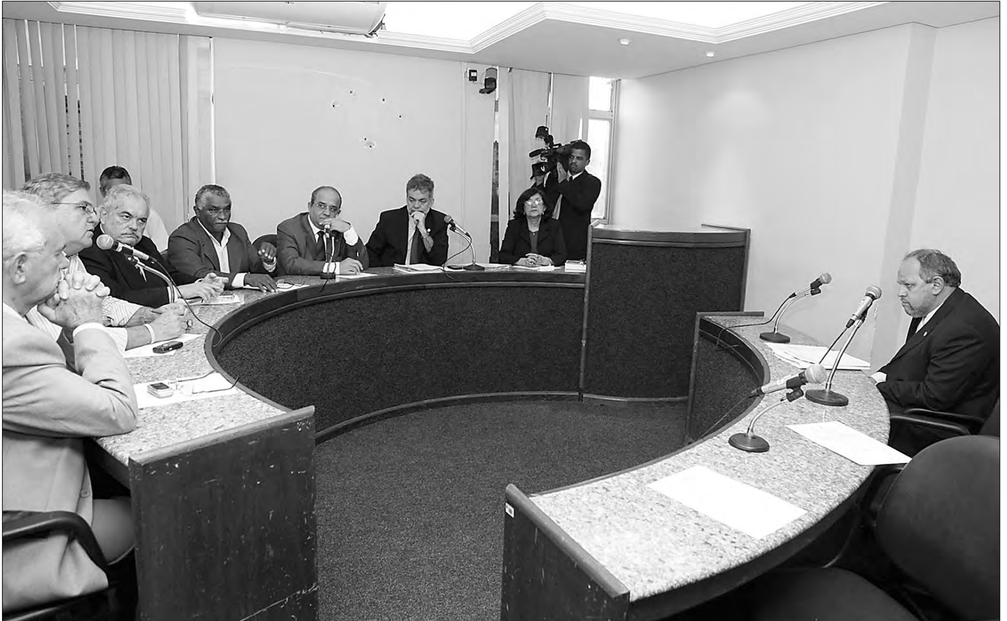
AGILIDADE - Deputados e Governos Federal e Estadual estão empenhados na busca de soluções urgentes para os funcionários e para que a unidade volte a moer