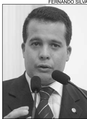
EDSON - Competitividade

Para Vieira, a feira é considerada uma das maiores do setor no Nordeste. "A Comtex se constitui, hoje, uma ferramenta estratégica para fomentar o mercado interno da indústria têxtil, contribuindo na atualização dos empresários e profissionais ligados à moda", observou, acrescentando que, além de produtos e tecnologia, o evento também oferecerá palestras