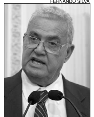
GERALDO - Medidas

Defendendo a privatização de empresas, Coelho falou sobre o histórico da Vale do Rio Doce, que, em 1977, foi privatizada e continua se afirmando no mercado. "O Brasil desperta muito interesse em investimentos externos, países como os