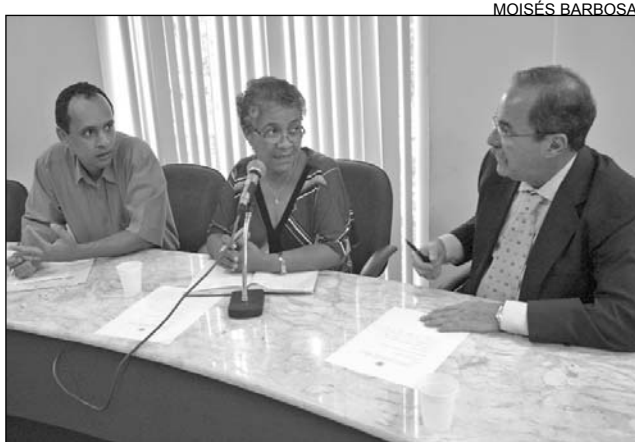
PREJUÍZO - Uma cratera de 30 hectares na localidade

Outras ações também foram marcadas para o mês de maio. A primeira visita técnica será no dia 3. Os