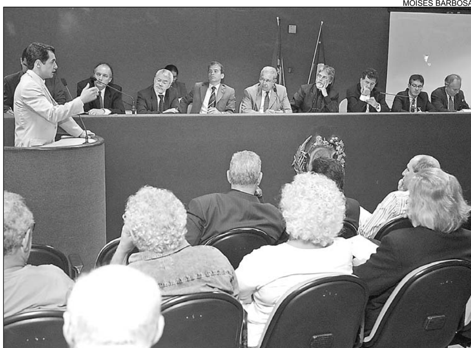
IMPORTÂNCIA - Legislativo pernambucano acompanha a reestruturação da entidade