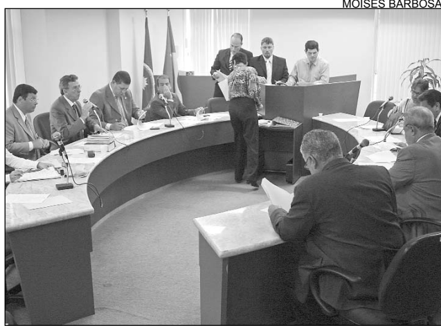
ACORDO - Colegiado elogiou iniciativa do Executivo

A legislação define normas sobre o ingresso na carreira, atribuições, prerrogativas, vencimentos, vantagens, indenizações, capacitação profissional, direitos e deveres. A proposição recebeu uma emenda supressiva de autoria do Governo. Segundo o presidente da CCLJ,