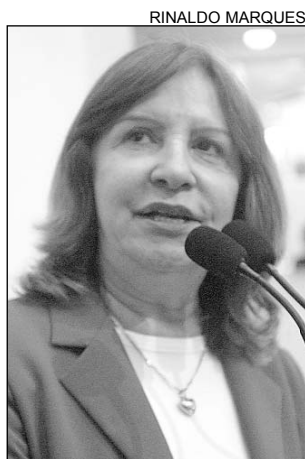
TEREZINHA - Pesquisa

Outra empresa contratada pela PCR sem licitação foi a