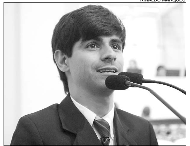
HOMENAGEM - Airinho enalteceu os 46 anos da cidade

Airinho agradeceu à população pelo apoio recebido na eleição de 2006. "O povo me confiou uma expressiva votação e fui eleito deputado majoritário no município", disse, acrescentando que a economia da cidade gira em torno da agricultura, caprinocultura e ovinocultura. "Quero lembrar esta data com muita alegria", destacou.