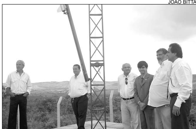
ALERTA - Estímulo ao estudo da Física não recebe apoio

"Sempre lancei foguetes no Sul do País e senti a ne-