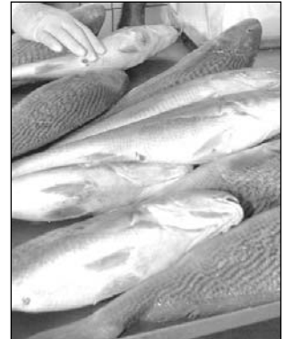
PEIXES - Poluentes

Entre as reivindicações apresentadas no documento intitulado Grito da Pesca Artesanal; está a unificação dos conceitos de pescadores para a obtenção dos registros de pesca e demais benefícios. "É necessário, também, que seja implantado pela Seap o Programa de Isenção