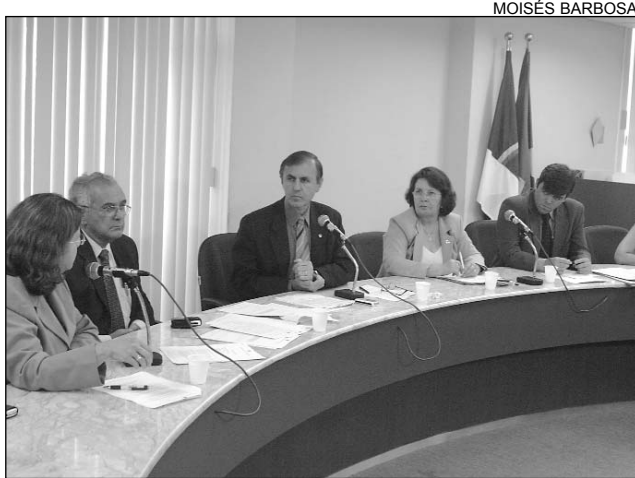
STF - Órgão concedeu ganho de causa aos professores