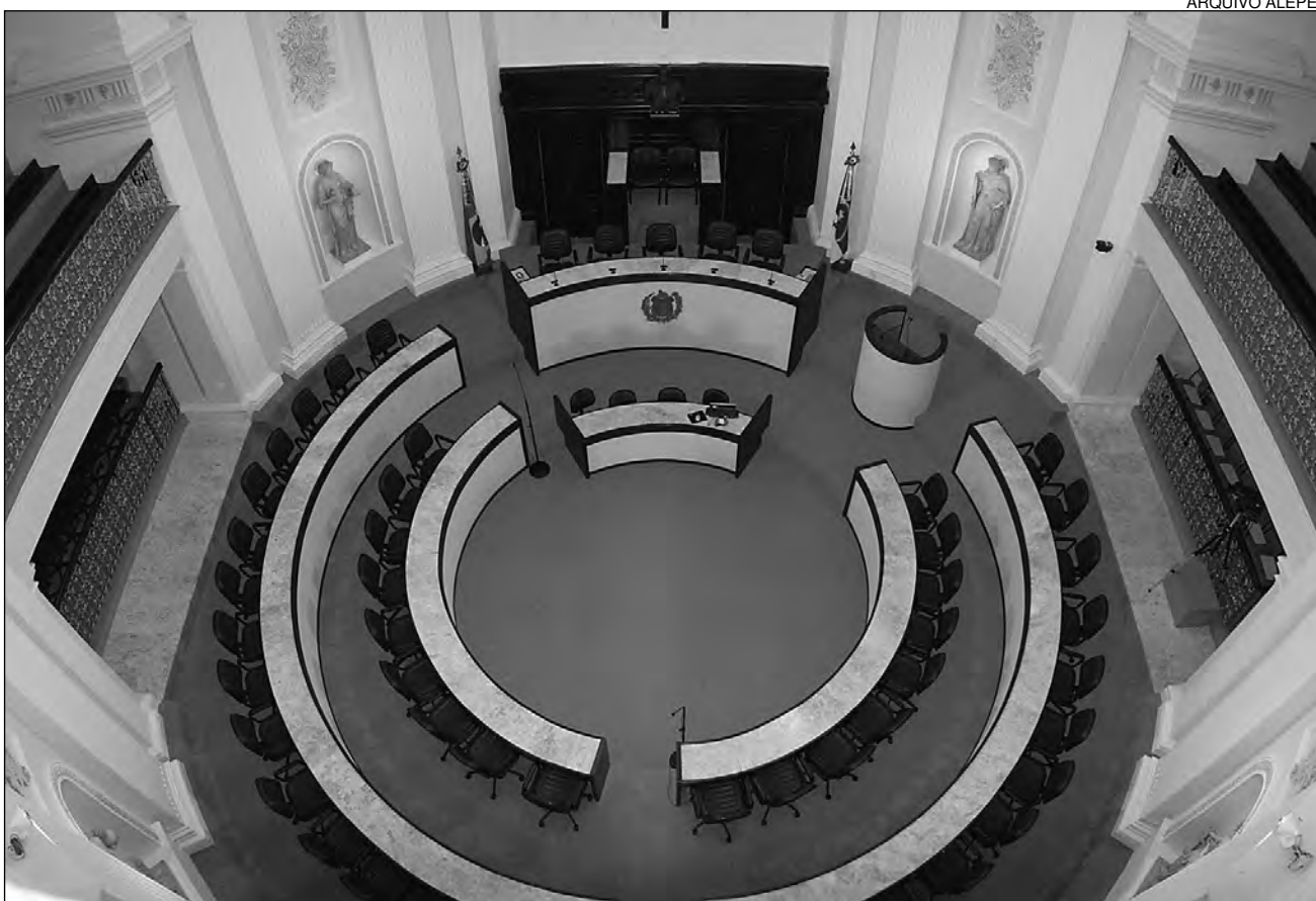
CASA JOAQUIM NABUCO - É no Plenário que ocorrem as principais reuniões dos parlamentares pernambucanos

quatro horas, podendo ser prorrogada pelo prazo máximo de até duas horas,