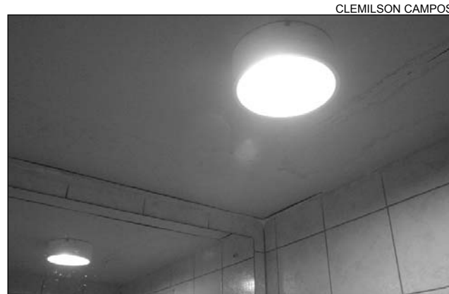
BEM-ESTAR - Para Esmeraldo, ação fixa homem no campo

"Tacaimbó está inserido no Programa Luz para Todos, mas, à medida que a cidade foi crescendo, a distribuição de energia não pôde alcançar determinadas áreas", lamentou. Es-