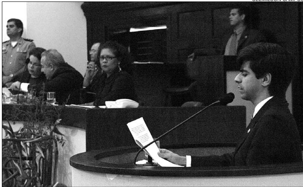
RECONHECIMENTO - Airinho solicitou Voto de Aplausos para a instituição