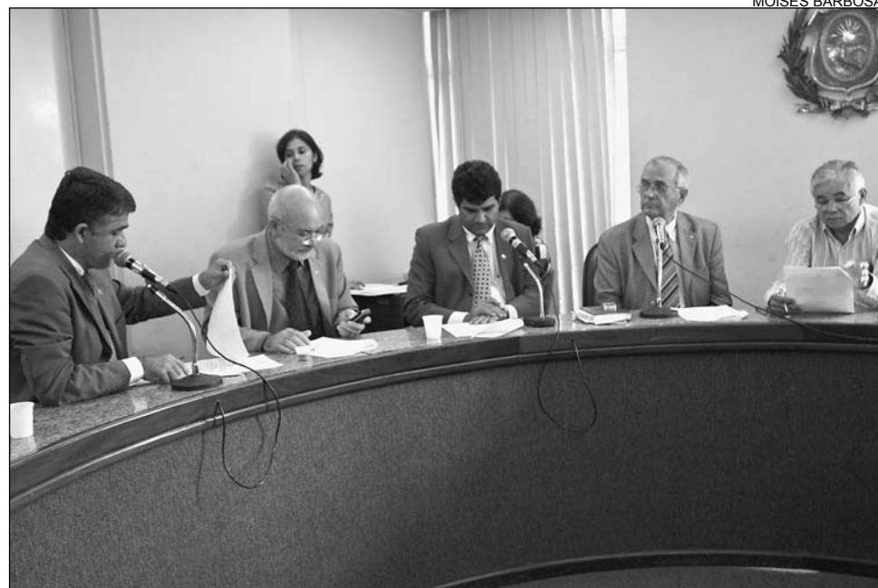
IDÉIA - Gerar comprovante de leitura durante a aferição dos medidores de energia