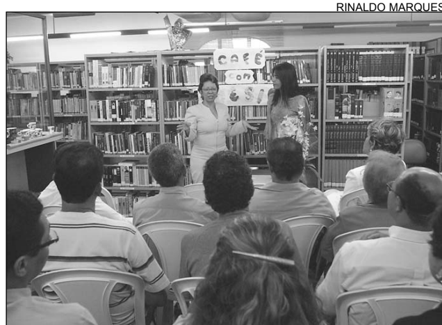
ARTE - Servidores também apresentaram textos próprios

As comemorações na Biblioteca prosseguem hoje, a partir das 9h, com a Simultânea de Xadrez. Amanhã, acontece a Oficina de Reciclagem com Papel Machê.