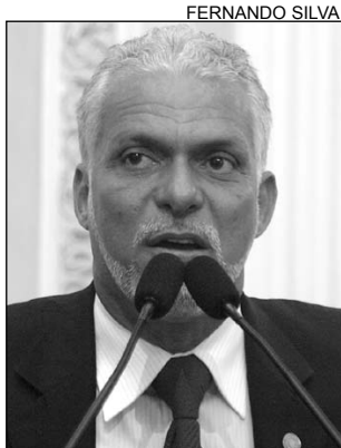
LEITE - Medida equivocada

O parlamentar criticou o Executivo por não ter feito um estudo sobre a incidência criminal. Segundo Leite, as condições impostas para o funcionamento dos bares não são viáveis. "A crise financeira por que esses estabelecimentos passam já é grande. Há a impossibilidade de contratar pessoal de empresa especializada para fazer a