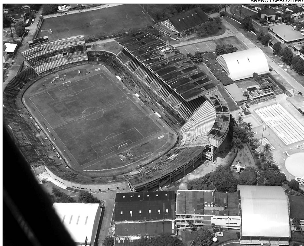
ILHA - Estudante Felipe de Moraes, 23 anos, morreu vítima de infarto no sábado

A proposta dos deputados tucanos ainda revoga a Lei nº 12.882, de 20 de setembro de 2005, que determinava que o aparelho deveria estar disponível apenas em casas de espetáculos, estádios de futebol e ginásio de esportes.