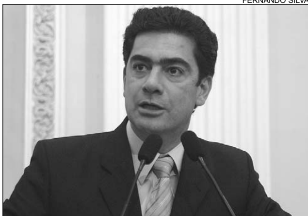
PIMENTEL - Socorro rápido amplia chance de sobrevivência

"O episódio está sendo recorrente nos campos de futebol. Ora envolvendo jogadores, ora torcedores", disse Pimentel, acrescentando que cerca de 90% das