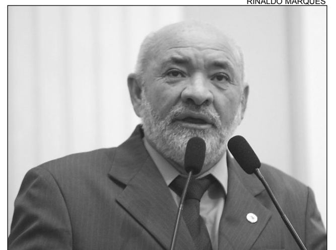
ESTRUTURA - Santos pediu apoio ao Governo do Estado

O atual Corpo de Bombeiros atende a 25 municípios que contabilizam 620