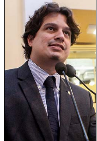
PARTICIPAÇÃO - “Sucesso”

nos últimos governos, como os Programas Ganhe o Mundo Esportivo, Bolsa Atleta de Pernambuco, Time PE e Passaporte Esportivo, além da Lei Estadual de Incentivo ao Esporte, dos Jogos Escolares, Jogos Indígenas e Jogos Paraolímpicos de Pernambuco.