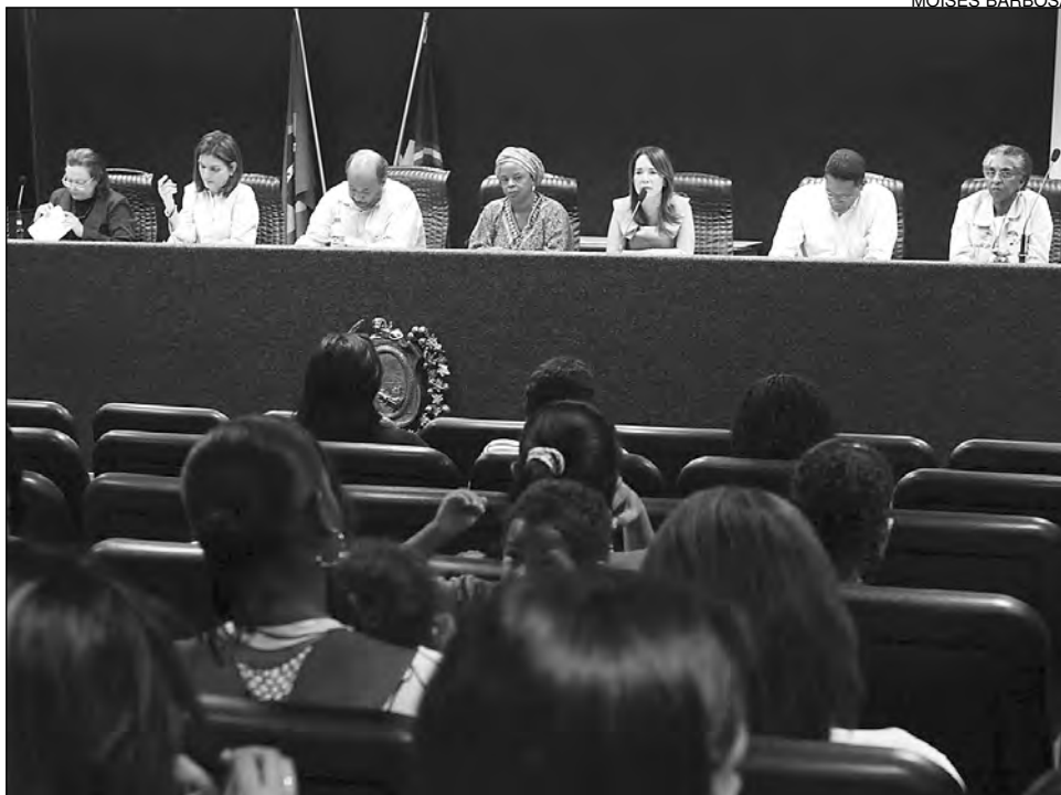
AUDITÓRIO - Representantes de instituições trataram problemática e deram sugestões