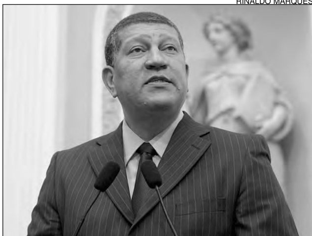
NASCIMENTO - Medida aguarda, agora, sanção federal

A conquista dos profissionais da área de Assistência Social, que conseguiram a redução da carga horária para 30 horas semanais, ganhou destaque no Pequeno Expediente de ontem. Responsável por fazer o registro, no Plenário, o líder do Governo na Casa Joaquim Nabuco, deputado Isaltino Nascimento (PT), explicou que a medida integra o Projeto de Lei Complementar nº 152/2008. A proposição foi acatada no Congresso Federal, no último dia 17, seguindo para a sanção do presidente da República, Luiz Inácio Lula da Silva.