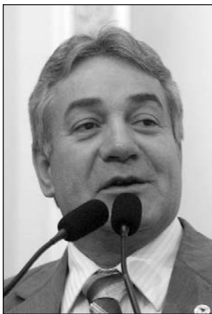
AUTORIA - Izaías Régis

T abelas entre 30 centímetros e 50 centímetros de largura e 40 centímetros e 60 centímetros de comprimento deverão ser afixadas nas agências bancárias, nos espaços interno e externo, informando os preços cobrados pelos serviços financeiros. A iniciativa é reflexo da Lei nº 13.192, promulgada em janeiro deste ano, de autoria do deputado Izaías Régis (PTB). A idéia é conscientizar os clientes sobre as despesas previstas para quem deseja usufruir os benefi-