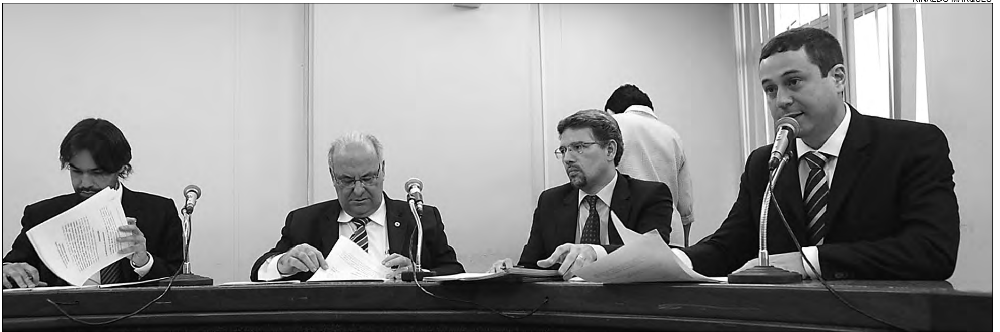
COPA 2014 - Integrantes do colegiado desejam conhecer melhor planejamento traçado pelo Poder Executivo de Pernambuco para sediar disputa do mundial