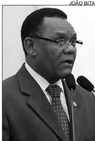
TRIBUNA - Igualdade

“Meu objetivo é representar a vontade dos cidadãos. Acredito que a política é um instrumento essencial para alcançarmos o pleno desenvolvimento”, ponderou o parlamentar, que ocupa o cargo, desde o início do mês, após a decisão do Supremo Tribunal Federal (STF) em dar posse aos su-