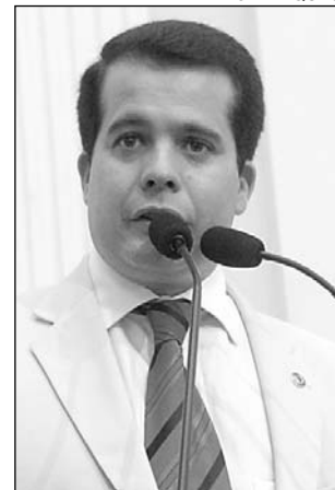
VIEIRA - Setores variados

O crescimento econômico do Interior do Estado foi comemorado, ontem, pelo deputado Edson Vieira (PSDC). O parlamentar repercutiu a matéria publicada no Jornal do Commercio que registrou os investimentos em vários setores, em especial, o da construção civil, cuja previsão de crescimento para este ano está entre 10% e 12%. “É preciso dotarmos o Interior de infra-estrutura, a fim de atrair investimentos e aproveitar o crescimento do Complexo Portuário de Suape”, frisou.