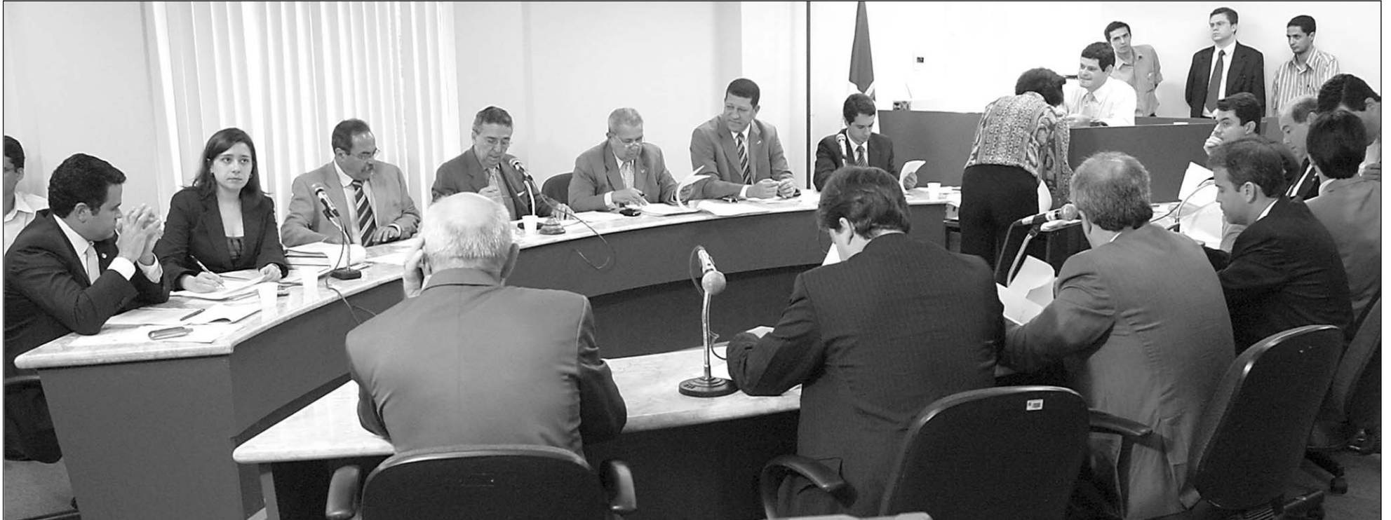
COLEGIADO - Parlamentares aprovaram, em reunião da Comissão de Constituição, Legislação e Justiça, matéria que pode beneficiar 350 mil pessoas em Pernambuco