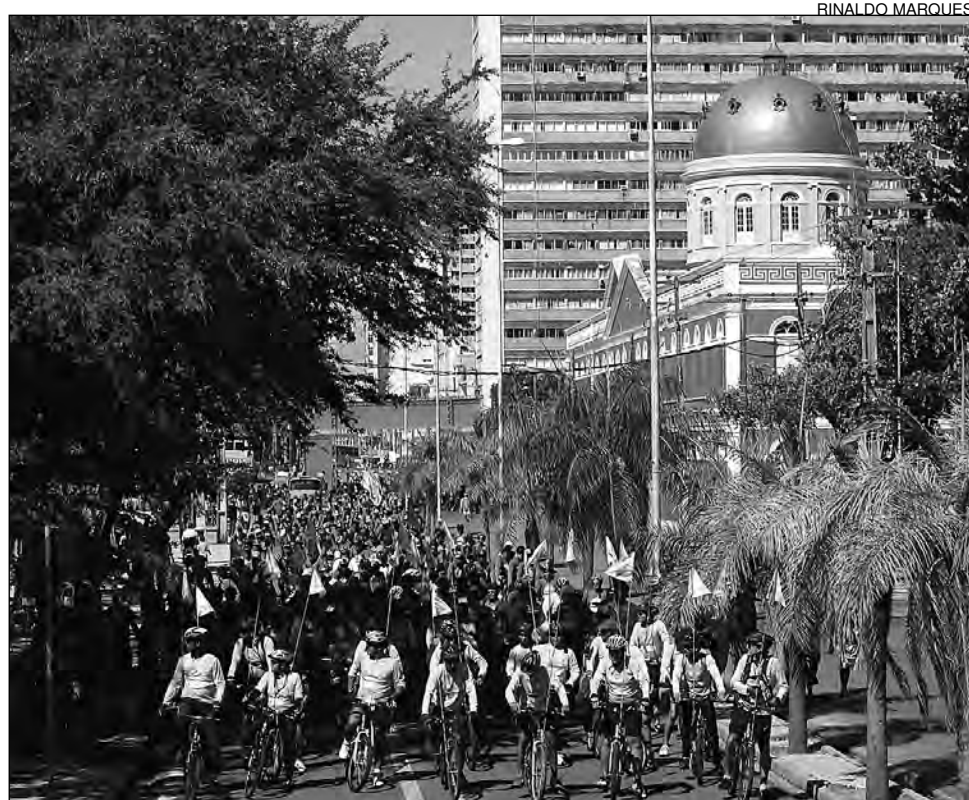
PERCURSO - Com início na Rua da Aurora, o trajeto tem extensão de 16 quilômetros

O percurso, que tem início na Rua da Aurora, em frente ao Museu Palácio Joaquim Nabuco, abrange 16 quilômetros. Na ida, os ciclistas passarão pela Ponte do Limoeiro, Cais da Alfândega, Ponte Giratória, Cais de Santa Rita, Cais José Estelita, Ponte Paulo Guerra, Avenidas Herculano Bandeira e Domingos Ferreira e Rua Arthur Muniz. Após uma parada no 2º Jardim de Boa Viagem, os participantes voltam pela Antônio de Góes, Cais José Estelita, Avenidas Martins de Barros e Guararapes, Ponte Duarte Coelho e Rua da Aurora, retornando à Alepe.