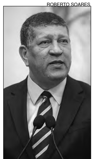
TRIBUNA - Nascimento

Segundo o parlamentar, a região deverá receber ações de infraestrutura, como a implantação das rodovias PE-44 e PE-46. Ele ainda afirmou que a situação do polo merece atenção especial e deu o exemplo do município de Itaquitinga, que não dispõe de agência bancária. “A partir das discussões da Comissão, podem surgir soluções para atenuar os riscos sociais e ambientais que podem