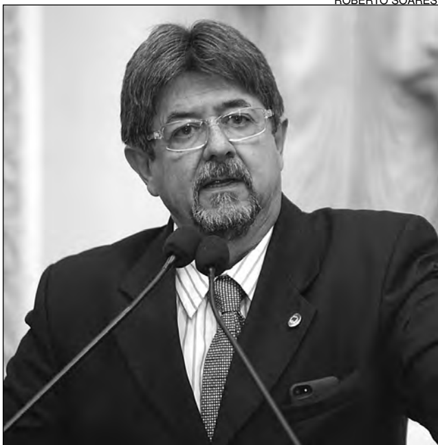
CÉSAR - Solicita reforço do efetivo policial na região