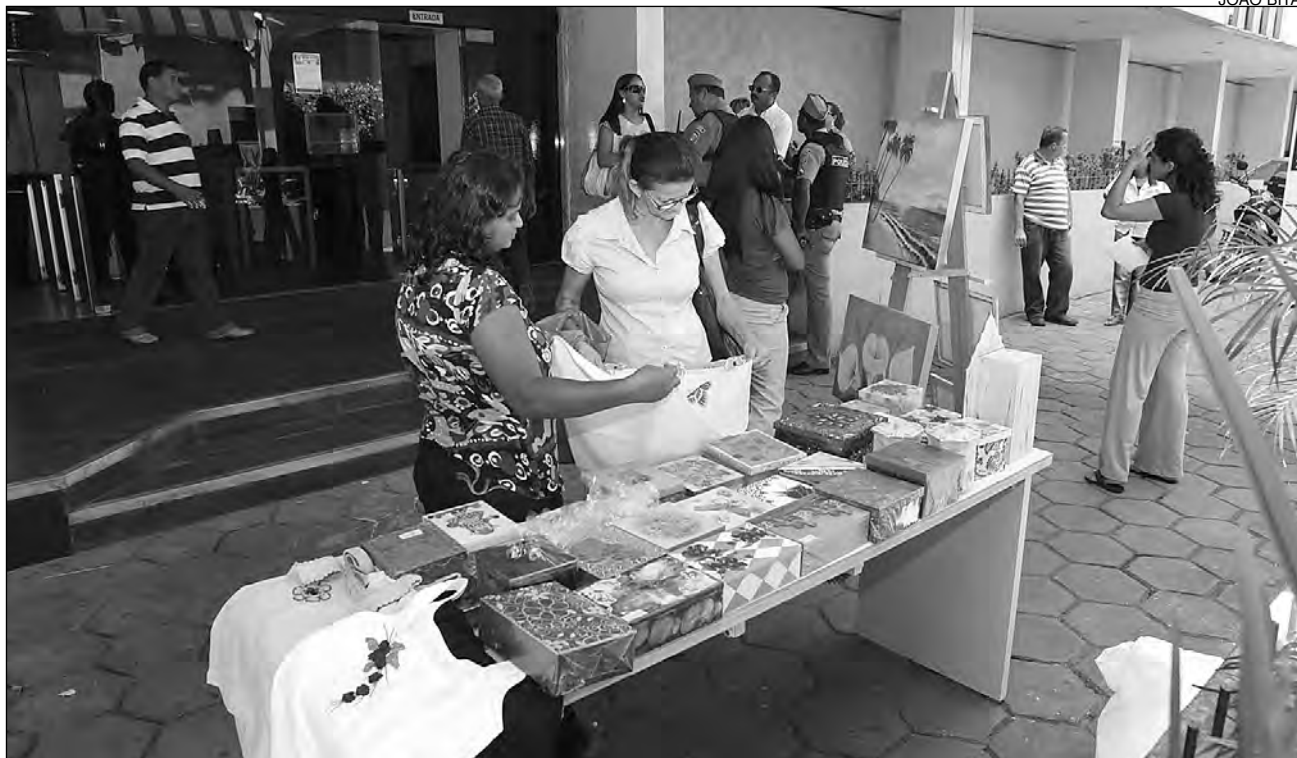
RENDA - Venda de produtos contribui para fortalecer cidadania das menores em situação de vulnerabilidade