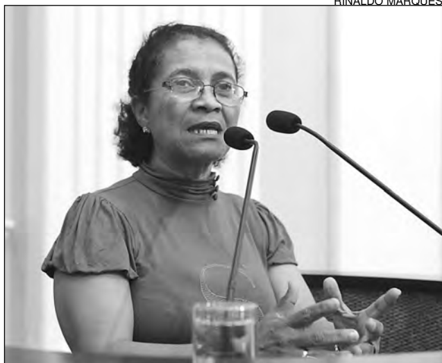
CEÇA - Iniciativa da Comissão de Meio Ambiente

As ações do Projeto Pernambical, iniciativa implementada pela Comissão de Meio Ambiente da Casa, a fim de elaborar políticas públicas e fazer um diagnóstico das diversas regiões do Estado, ganharam destaque, na tarde de ontem.