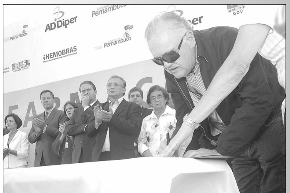
APOIO - Presidente da Assembleia Legislativa assinou documento como testemunha

“O setor farmoquímico é estratégico na economia mundial. O empreendimento vai possibilitar inúmeras trocas de conhecimento na área da biotecnologia”, ponderou Eduardo Campos. O deputado Luciano Moura (PCdoB) e o líder do Governo na Alepe, Isaltino Nascimento (PT), também participaram do evento. Na ocasião, ainda estiveram presentes secretários de Estado, deputados federais, entre outras autoridades.