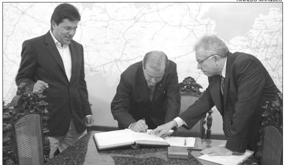
CERIMÔNIA - Presidente da Alepe (c) disse que cumprirá rigorosamente agenda