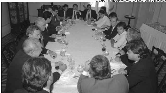
REUNIÃO - Deputados participaram de almoço no Palácio

deixou acertado com a equipe", salientou.