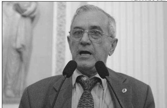
CLAREZA - Mavíael acredita na transparência do processo

"O financiamento público irá diminuir a dependência dos partidos com as empresas que arrecadam fundos para patrocinar as campanhas eleitorais, mais transparência, inclusive du-