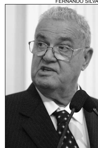
COELHO - Amizade

O parlamentar comentou ainda sua boa relação com o Consulado Japonês do