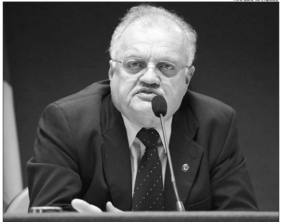
ANÚNCIO - Presidente Guilherme Uchoa detalhou procedimentos adotados