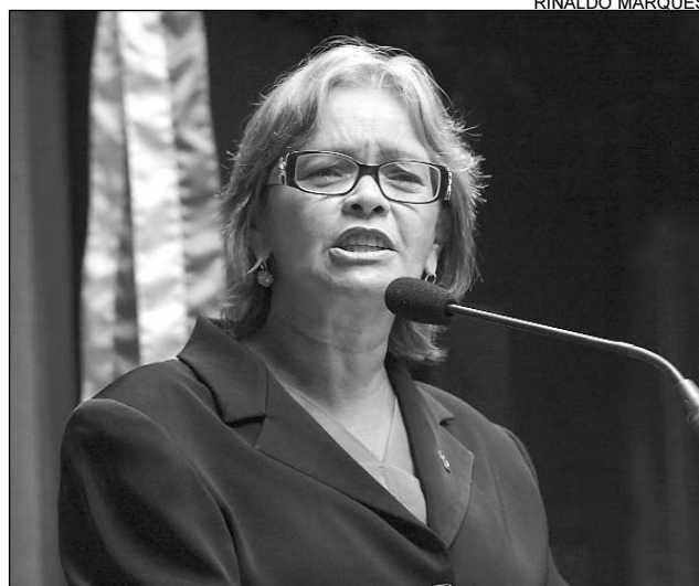
PACIENTE - Nadegi disse que atendimento será ampliado

A deputada parabenizou a Secretaria Estadual de Saúde pelo empenho junto ao Ministério da Saúde para credenciar os dois hospitais como unidades de ensino. "Dessa forma, será possível captar mais recursos e desenvolver atividades como pesquisas, formação de profissionais, entre outras melhorias", salientou.