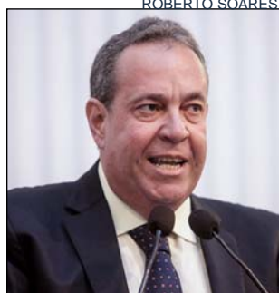
PROTESTO - “Inacessível”