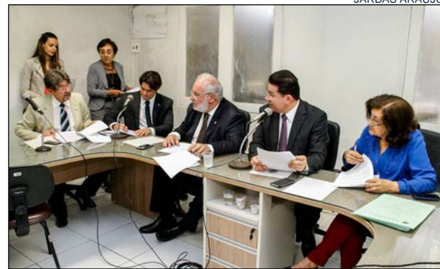
PROPOSTA - Governo do Estado negociou concessão