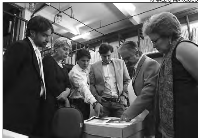
PAUTA – Qualificar profissionais é uma das necessidades

projetos; e a elaboração de um organograma próprio para o Arquivo Público. Atualmente, a unidade integra a estrutura da Secretaria de Educação do Estado.