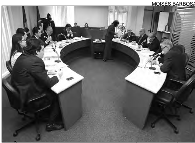
MOISÉS BARBOSA PRÊMIOS - Vencedores ganharão de R$ 300,00 a R$ 2 mil

Os textos deverão ser originais e ter, no mínimo, 50 páginas. Serão enviados, pelos Correios, à Co-