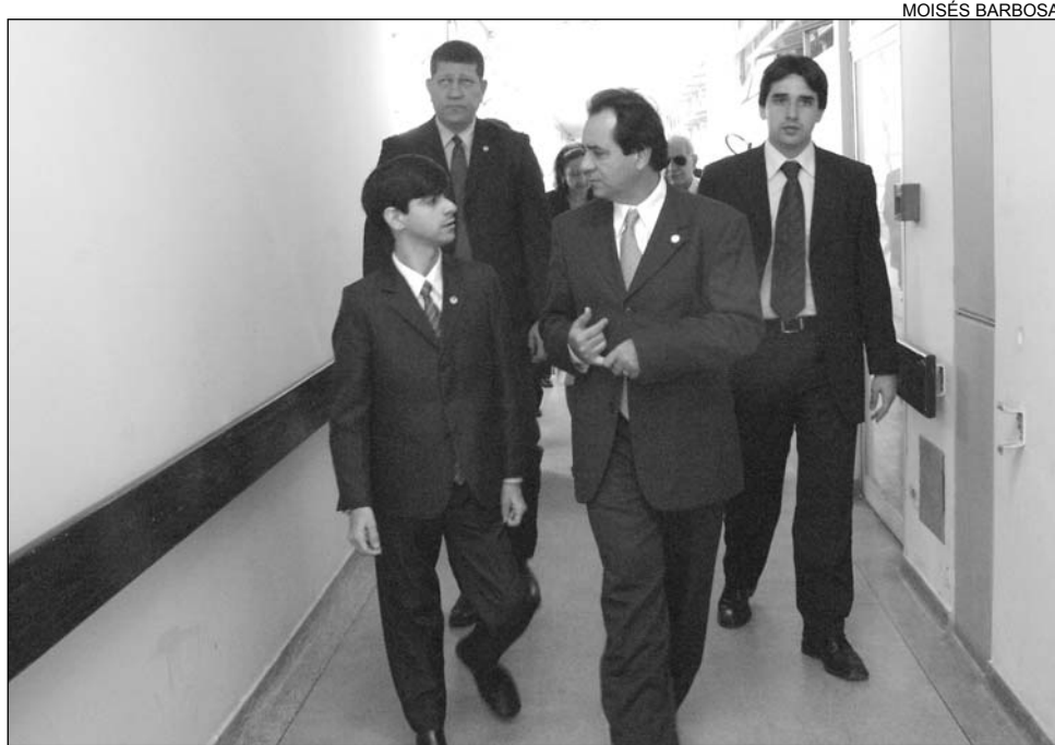
DÉBITO - Unidade também acumula dívida de R$ 3,5 milhões, dificultando o atendimento

A questão é que grande parte dos pacientes atendidos no local não reside na cidade do Recife. De acordo com levantamento feito pelos gestores do Getúlio Vargas, no período de apenas uma semana, foram atendidos 37 pacientes de Abreu e Lima, 29 do Cabo de Santo Agostinho e 246 de Camaragibe.