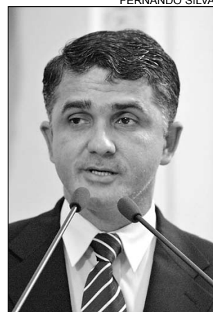
ACUSAÇÃO - Panfletagem

"Em vez de abordar os veículos para fiscalizar e garantir a segurança da população, os policiais estão panfletando, numa demonstração clara de desvio de função", declarou o socialista. A ação, que foi apelidada pela tropa de Operação Flanelinha, está sendo moni-