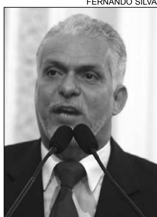
AUTOR - Cidadania

Baseando-se em reportagem publicada na edição da Folha de Pernambuco do último domingo, tratando sobre a busca a pessoas desaparecidas, o parlamentar destacou a necessidade de criar mecanismos como o cadastro. "Esse é um problema sério, o número de