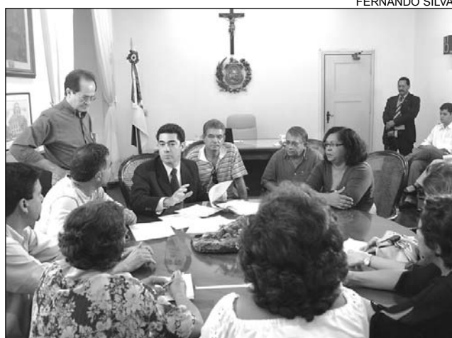
PIMENTEL - Estado é um dos primeiros a adotar medida

Pimentel destacou que Pernambuco é um dos primeiros Estados a tomar a iniciativa de formar uma Agência de Vigilância Sanitária e ressaltou a importância de esclarecer todos os