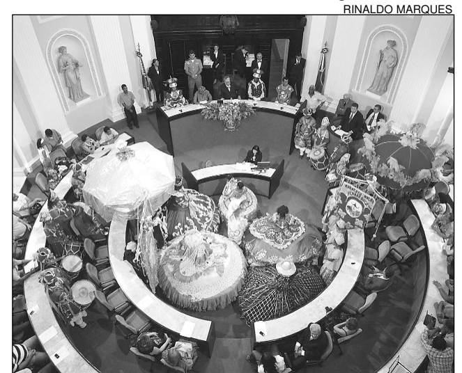
CORES - Parlamento reverenciou milésima apresentação