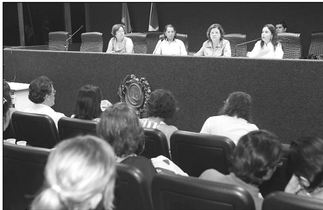
SAÚDE - Colegiado debateu problemática com ONG Gestos

Na década de 80, quando surgiu a Aids no Brasil, a estimativa era de uma mulher infectada para cada grupo de 26 homens. Hoje, a proporção é de 1 para 1,5. Atualmente, mais de 474 mil casos, incluindo ambos os gêneros, foram registrados no País até 2007. Trinta e duas mil pessoas são infectadas anualmente.