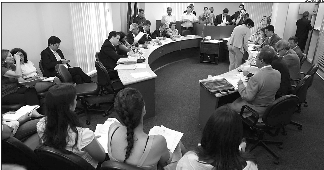
ENCONTRO - Constituição, Legislação e Justiça acatou remanejamento da verba proposto pelo Poder Executivo

A proposta investe na formação do setor produtivo, aprimorando os serviços prestados. Os centros tecnológicos oferecem suporte aos empreendedores e módulos de capacitação, além de