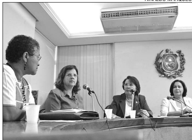
LEIS - Colegiado debate na AL importância da iniciativa