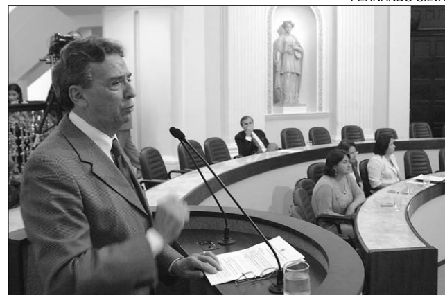
INFRA - 400 placas de concreto rachadas e esfarelado-se