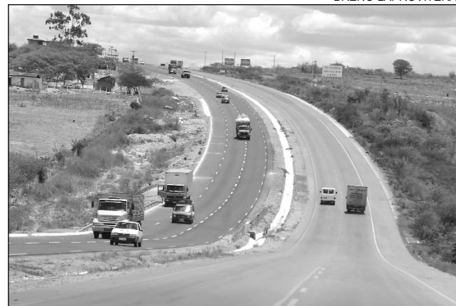
OBRA - Deveria durar 30 anos sem manutenção