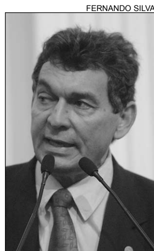
CONCURSO - Necessidade