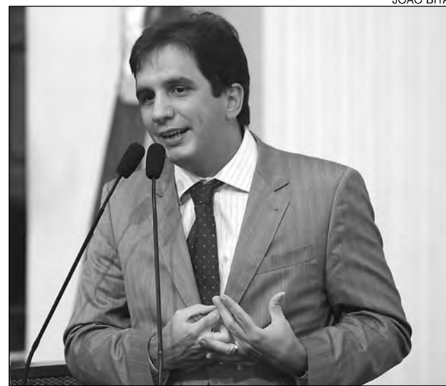
AGRADECIMENTO – Deputado Gustavo Negromonte