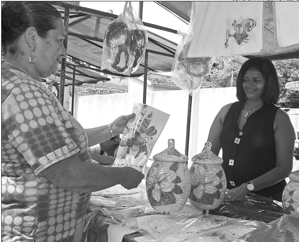
SOLIDÁRIA - Iniciativa vai fomentar políticas públicas que desenvolvam economia popular

Uma maneira diferente de lidar com a economia. No lugar dos grandes negócios, a atenção é voltada para a sobrevivência das pessoas com a perspectiva do bem viver de todos e para todos. Esse conceito define a economia popular solidária, que, agora tem espaço em Pernambuco. A Assembléia Legislativa do Estado tornou lei, no dia 18 de dezembro de 2008, a proposta do Poder Executivo que criou o Conselho Estadual de Economia Solidária (Ceeps).