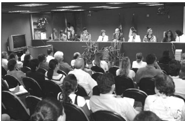
PRESEÇA - Encontro lotou auditório do anexo I da Casa

Temas como Superintendência Administrativa; O Cerimonial na Atividade Parlamentar; Superintendência de Planejamento, Execução Orçamentária e Financeira; Superintendência de Recursos Humanos e Superintendência de Modernização Institucional e Tecnológica foram abordados ontem. Processo Legislativo, Auditoria, O Político e a Imprensa serão alguns dos assuntos discutidos hoje. As palestras acontecem no Auditório, no 6º andar do Anexo I.