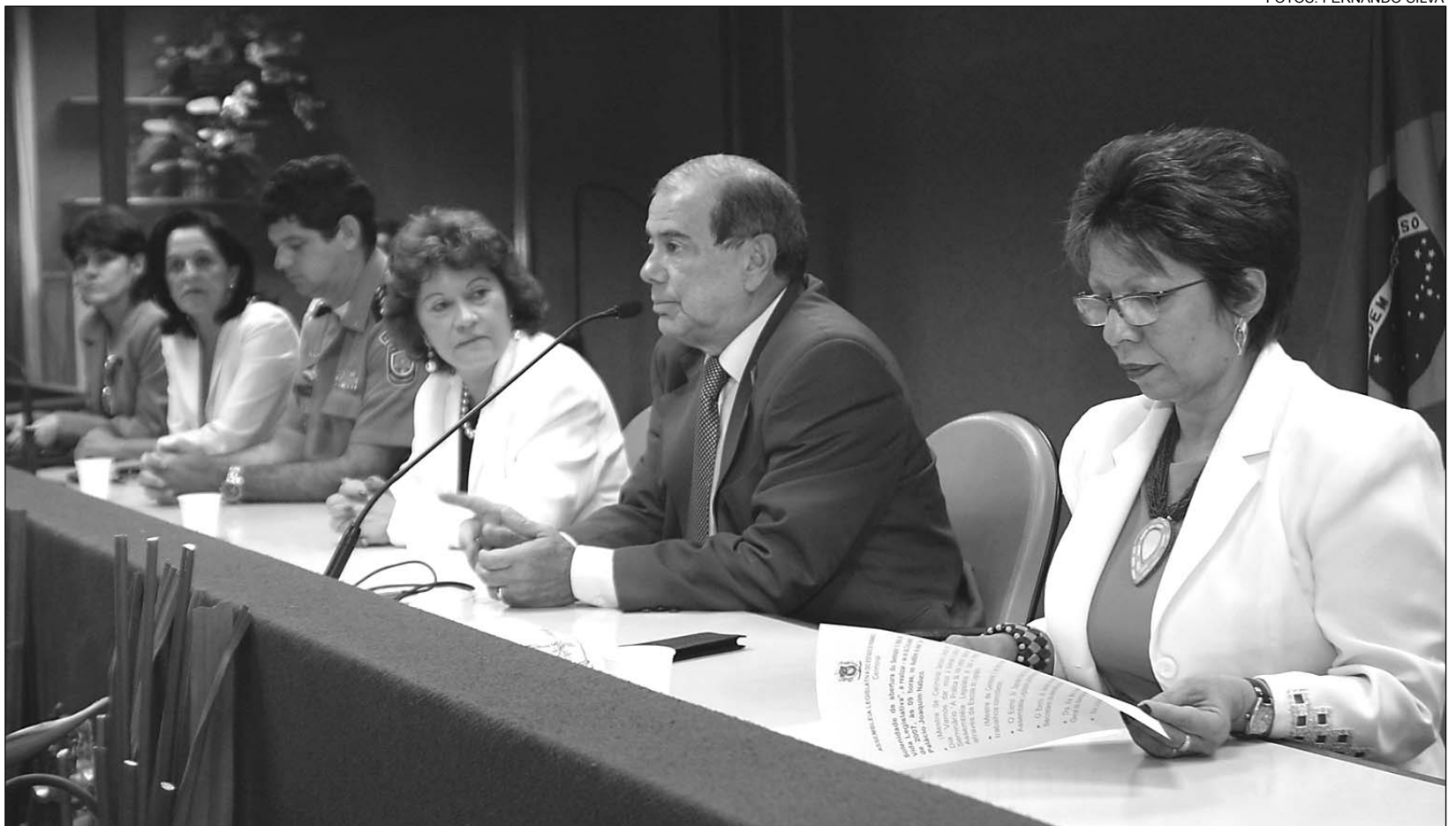
IMPORTÂNCIA - Presidente da Alepe, deputado Romário Dias, falou aos servidores novatos sobre o trabalho desenvolvido pela instituição em várias áreas

De acordo com o pe-felista, ao promover o evento, a Assembléia visa otimizar ainda mais as práticas legislativas na 16ª Legislatura, que terá início no próximo dia 1º de fevereiro. "Chega em boa hora esse treinamento, pois tudo o que é novo assusta. E o nosso foco é simplificar, informando os assessores sobre o funcionamento do Parlamento,