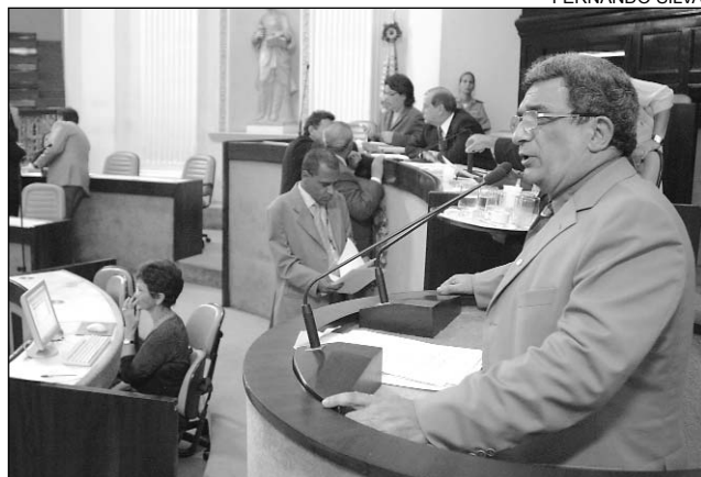
RESPALDO - Deputado disse que AL apóia ações pacíficas

O deputado elogiou a decisão da Assembléia de cancelar a audiência pública para debater o reajuste, marcada para hoje. Em nota à Imprensa, a Casa divulgou que "o Poder Legislativo reafirma seu papel de apoiar qualquer movimento pacífico que tenha o objetivo de defender os direitos da população, como tem mediado em diversas situações, junto às mais diversas categorias. Entretanto, não pode ser conivente com