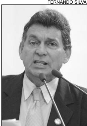
GASTOS - Acessibilidade