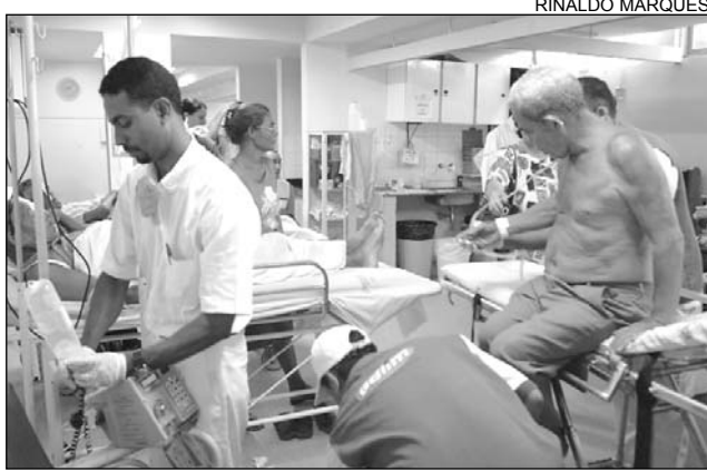
EMERGÊNCIA - Macas são insuficientes à demanda