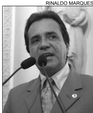
SANTANA - Preocupado

Santana registrou, ainda, uma pesquisa realizada pela Fundação Getúlio Vargas que diz respeito à solidão das mulheres nordestinas. De acordo com o tucano, o Recife tem o segundo maior índice (50,76%) de mulheres acima de 20 anos solteiras, separadas ou viúvas. "Na Capital pernambucana, existem 12,6 mulheres para cada homem adulto", comentou. O primeiro lugar ficou com Salvador (BA), com 50,91%. "Esse é