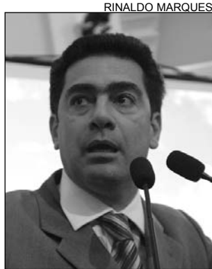
CRIME - Mangueira

A tentativa de homicídio contra o prefeito de Trindade, Gerônimo Figueiredo, no último final de semana, foi registrada, ontem, no Plenário, pelo deputado Raimundo Pimentel (PSDB). De acordo com o parlamentar, o fato aconteceu no distrito de Mangueira, durante o lançamento de um programa da Prefeitura. "Um cidadão portando arma branca investiu contra o prefeito