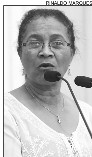
CEÇA - Falta incentivo