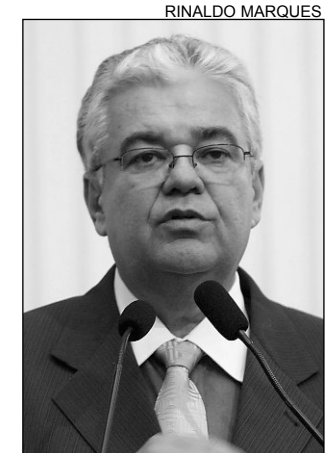
PEDIDO - Votos de Aplausos

“O grupo empresarial, às custas de muito trabalho e dedicação, cresce a cada dia. Parabenizo a todos os