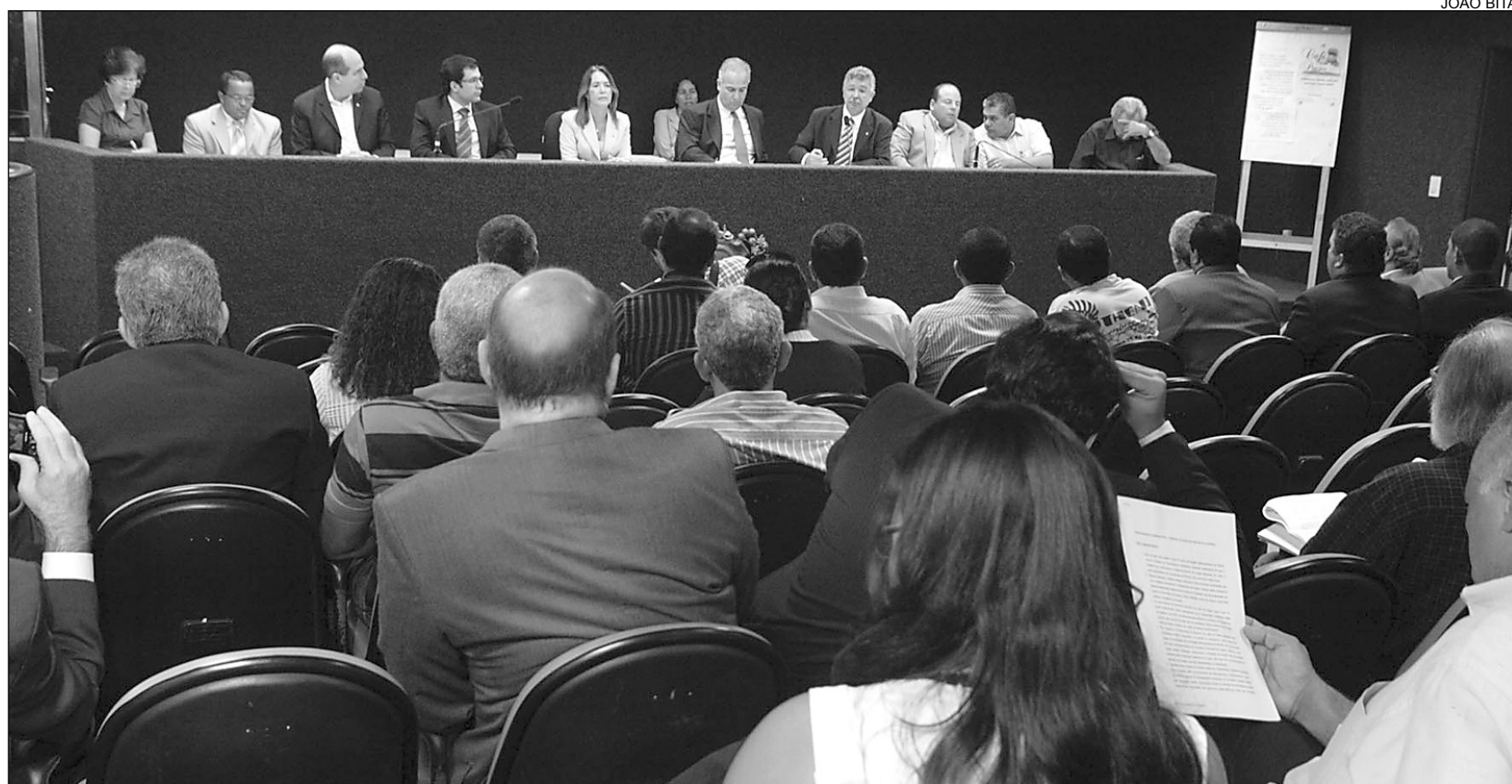
INTERESSE - Integrantes do colegiado de Desenvolvimento Econômico e outros políticos compareceram à audiência pública que tratou o assunto

“Pernambuco é o Estado que mais cresce no Brasil, no entanto, possui o menor Índice de Desenvolvimento Hu-