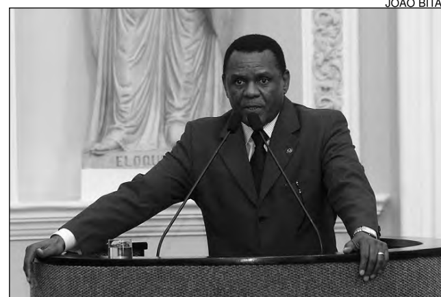
OSSESION SILVA - Foram avaliados os últimos 12 meses