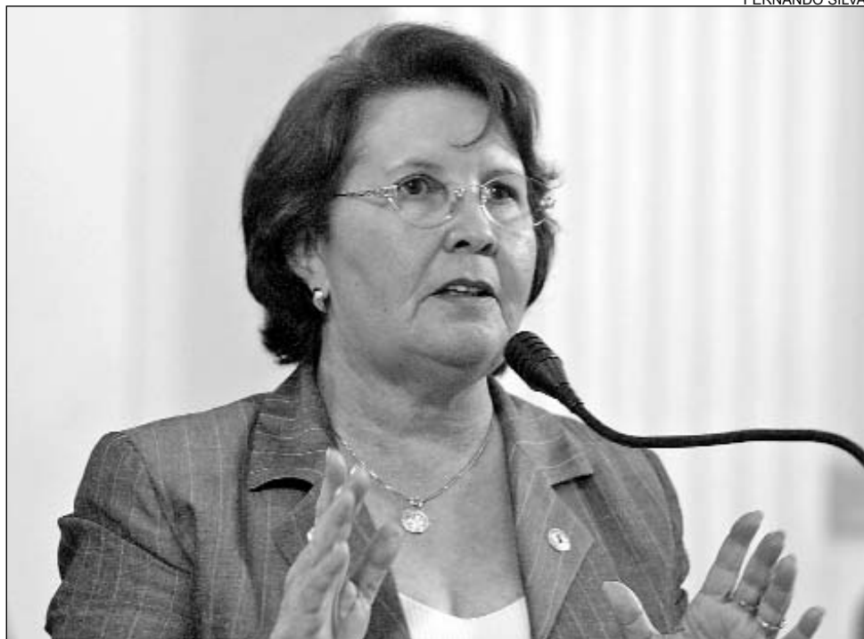
BANCOS - Sete instituições do País arrecadaram quase R$ 31 bilhões em 2005