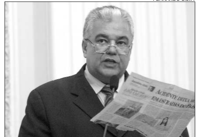
MORAES - Menos de R$ 1,00 ao dia por pessoa

Ainda no documento, as entidades dizem que "os Governos se tornam prisioneiros de sua política monetária" e pede que os candidatos à Presidência da República assumam o compromisso de cumprir a determinação constitucional de que a saúde é um direito de todos e dever do Estado.