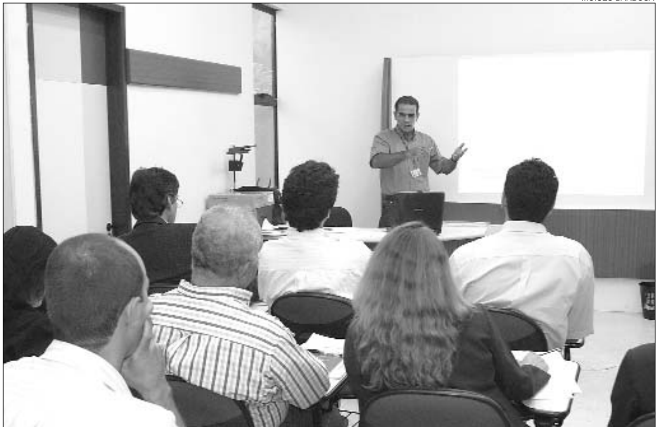
FORMAÇÃO - Elepe tem sediado eventos importantes para a formação de servidores e de outros profissionais

Para mais informações sobre a programação, basta ligar para 3217-2468. Depois desse primeiro encontro, as palestras continuam nos dias 30 de agosto e 5 e 13 de setembro.