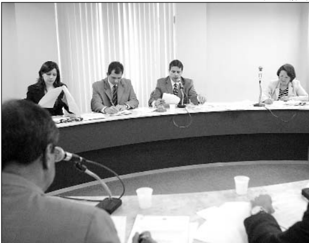
REUNIÃO - Colegiado acatou outras nove proposições