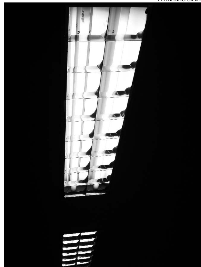
EQUIPAMENTO - Mudança aumentou valor da fatura

O parlamentar também enfatizou a cobrança irregular de taxas de iluminação pública. Segundo Leite, diversas Prefeituras do País es-