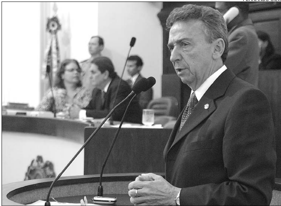
ESTRATÉGIA - Pedetista acusou ex-ministro Ciro Gomes de prejudicar Pernambuco

Segundo o pedetista, o percurso da ferrovia, que começa em Eliseu Martins, no Piauí, e corta Pernambuco até chegar ao Porto de Pecém, no Ceará, não contempla as potencialidades de desenvolvimento do Estado pernambucano. Para o presidente da Comissão de Administração Pública da Alepe, o aporte de recursos prioriza o porto cearense por causa da articulação política do ex-ministro da Integração Nacional e candidato a deputado federal Ciro Gomes (PSB). Com isso, "Pernambuco continua em plano se-