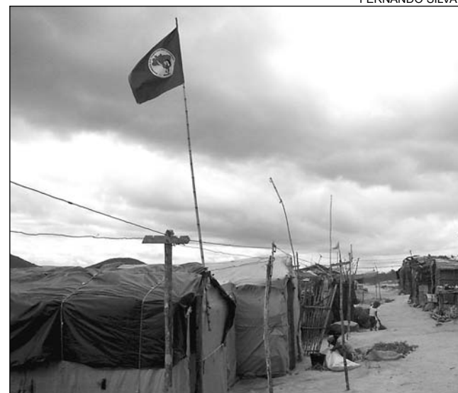
MANIFESTAÇÕES - Conflitos têm vitimado trabalhadores

O petista ressaltou que, enquanto essas práticas "abusivas e arbitrárias" continuarem a existir, ele denunciará e cobrará a aplicação de medidas legais de combate e punição. "É necessário que a população também cobre, pois é um direito dela receber serviço de qualidade. Vamos cobrar providências junto ao Ministério Público Federal em Pernambuco", informou.