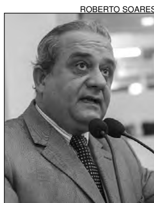
LESSA - Intervenções

De acordo com o deputado, a orla do Janga também está sendo reurbaniza-