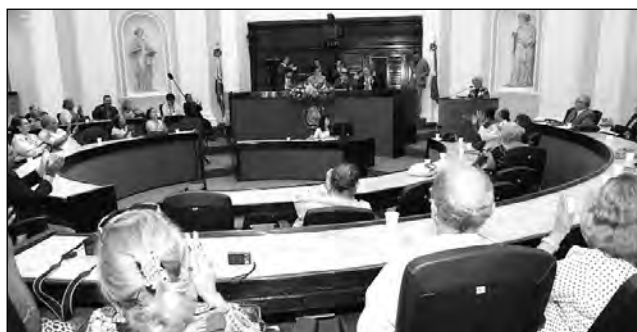
SOLENIIDADE - Escritores declamaram poesias na tribuna e dirigentes da UBE entregaram diploma a homenageados

O Sarau Quarta às Quatro é uma reunião literária semanal, ponto de encontro de poetas, escritores, intelectuais e artistas. Foi criado em março de 2003, pelo poeta Vital Corrêa de Araújo, no intuito de reavivar no Estado a efervescente cultura lite-