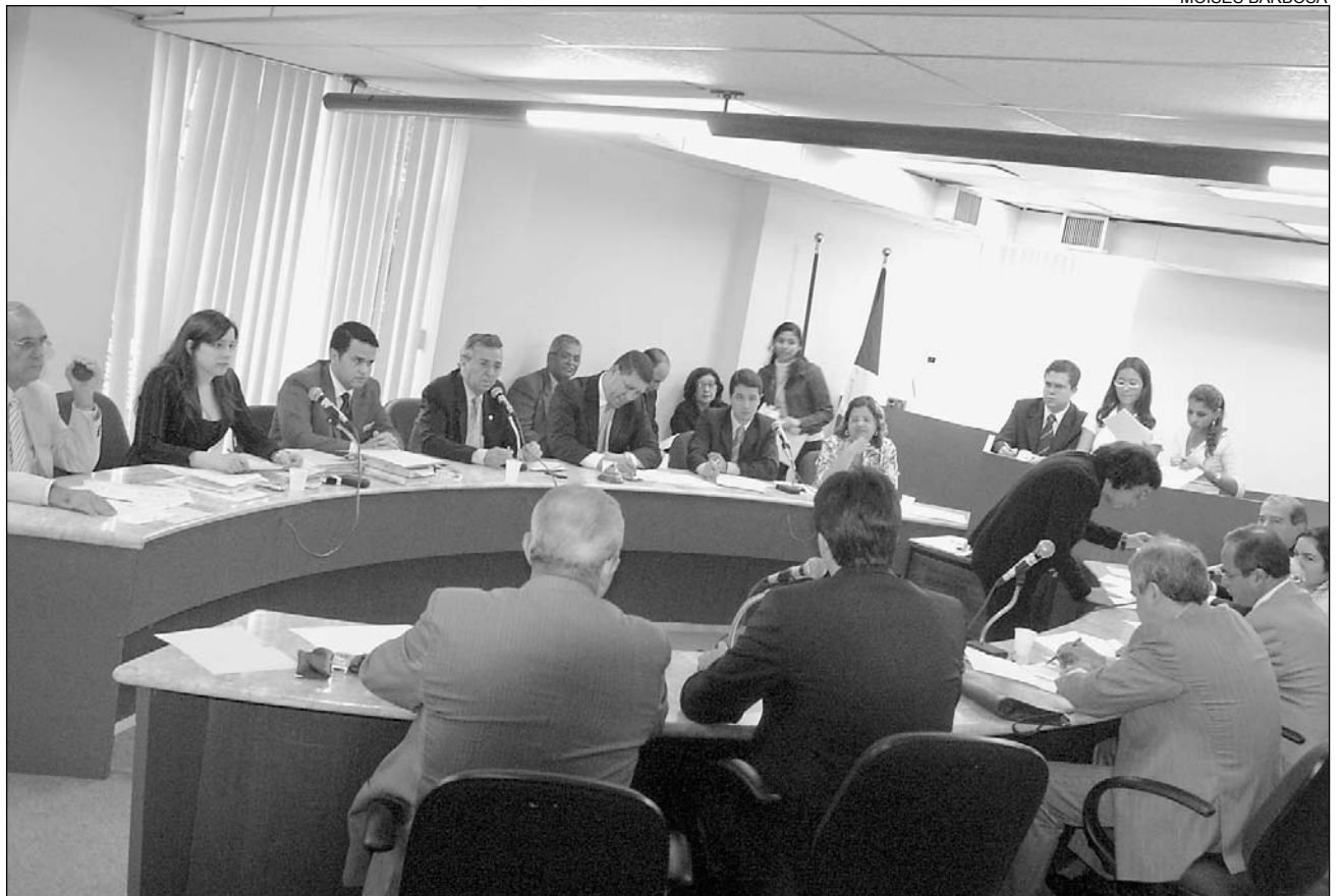
REGIMENTO - Artigos que tratam de questões relativas ao Plenário, como o tempo dos discursos, também foram apreciados

REGIMENTO – Também foi concluída mais uma etapa da análise do novo Regimento Interno da Casa. Foram avaliados os artigos 146 a 180. Os pontos debatidos tratam de questões relativas ao Plenário, como definições sobre as reuniões ordinárias, extraordinárias, especiais e solenes, o tempo de uso da palavra, inscrição de oradores e sobre o Pequeno e Grande Expedientes. Entre as mudanças propostas, está o aumento no tempo de liderança de três para cinco minutos e a fixação do número máximo de cinco oradores, tanto para o Pequeno quanto para o Grande Expediente, exceto nos casos em que o segundo for destinado a debates e palestras. Nesse caso, o Pequeno Expediente terá dez oradores.