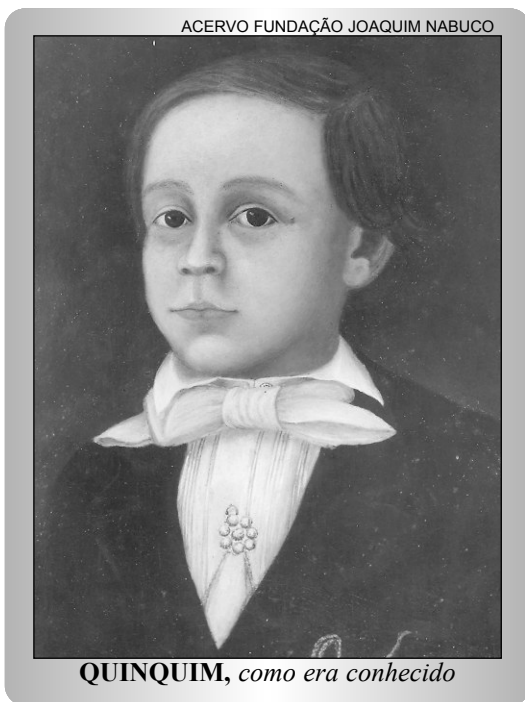
QUINQUIM, como era conhecido