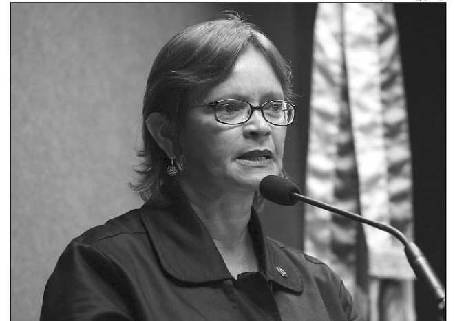
VIAGEM - Nadegi comentou visita às bases de controle

Ações sociais visando beneficiar a população também são atribuições da FAB. “A entidade presta auxílio operacional ao Governo, transportando vacinas, urnas