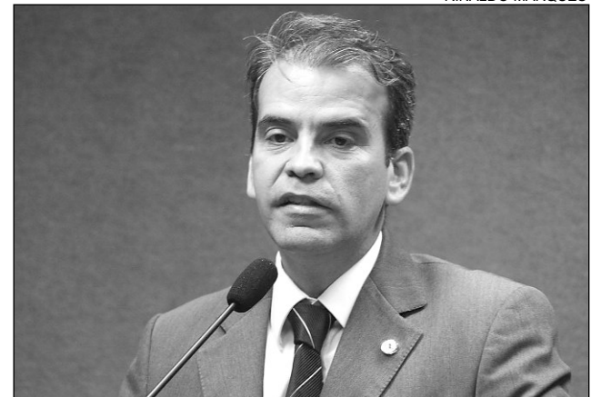
FEITOSA - Preocupação com pacientes domiciliares

A iniciativa, segundo o parlamentar, pretende minimizar os transtornos causados pelos cortes “nos dias em que o consumidor não poderá regularizar a situação ou solicitar a religação dos serviços.” “Na última terça-feira (21), feriado de Tiradentes, constatei mais de dez carros da Celpe nas ruas para efetivar os cortes. Nossa proposta não é proibir as medidas adotadas por inadimplência, mas garantir que o consumidor