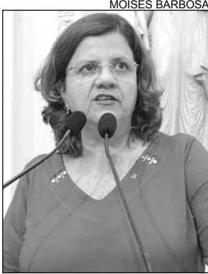
BRÁSILIA - Tema relevante

A parlamentar ainda fez um relato sobre o que considerou mais importante. Um dos pontos altos foi a aprovação da Conferência Nacional da Educação como política sistemática do MEC, contemplando todos os níveis educacionais no primeiro semestre de 2010. "Ela servirá como instância de debate na sociedade para a reelaboração do Plano