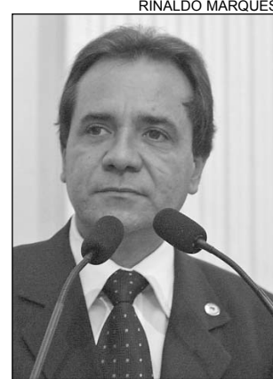
RESULTADOS - Santana

De acordo com o parlamentar, estão programados para os próximos anos investimentos superiores a R$ 14 bilhões, gerando milhares de empregos diretos e indiretos. Empreendimentos como a Refinaria Abreu e Lima, o Estaleiro Atlântico Sul e a Petroquímica Suape foram destaques no evento. "Todas essas iniciativas podem consolidar Pernambuco como a