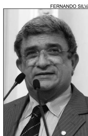
NEGROMONTE - Elogios