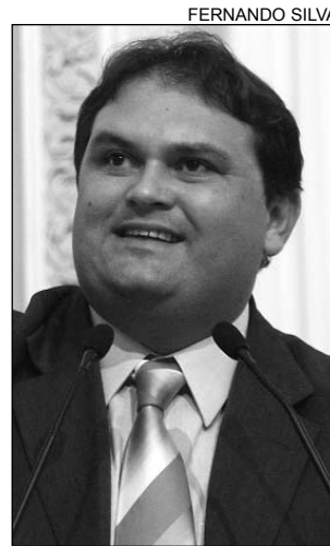
PROCESSO - Tumulto