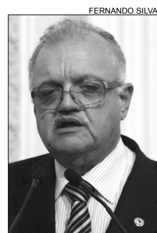
UCHÔA - Admiração