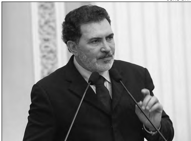
GEL - Abaixo o preconceito e valorização dessa parcela

“Desde que me submeti ao concurso para locutor da Rádio Liberdade de Caruaru , em 1976, comemoro o Dia do Radialista em 21 de setembro. Parabenizo todos esses profissionais e desejo que possamos usar nossa voz para servir ao povo bra-