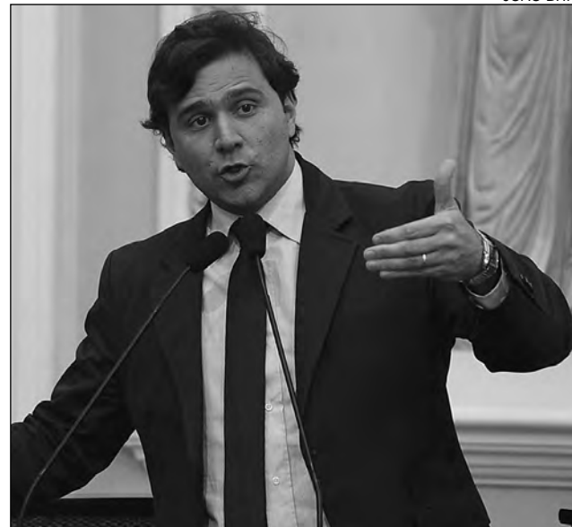
BAIXA RENDA - Rodrigo Novaes é autor da matéria