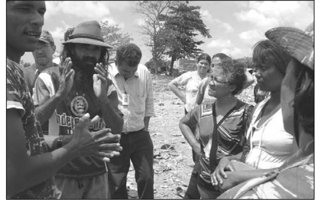
PAULISTA - 300 toneladas de lixo coletadas diariamente