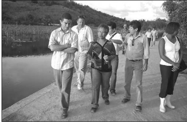
ARATACA - Colegiado observou risco de contaminação