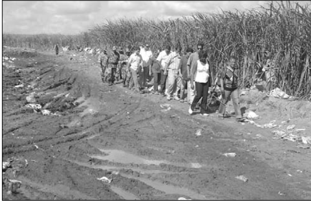
IGARASSU - Resíduos depositados em terreno particular