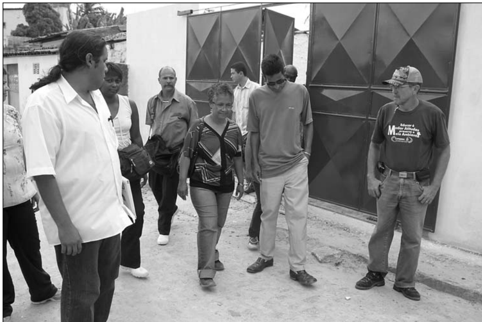
ABREU E LIMA - Cooperativa Érick Soares gera emprego e renda para recicladores

“É visível o empobrecimento do solo e muitas plan-