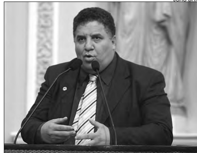
DROGAS - Collins falou sobre documento com sugestões

O parlamentar apresentou um Voto de Aplausos, durante o Pequeno Expediente, à iniciativa do Governo Federal. Como salientou o integrante do PSC, “existia distanciamento entre o trabalho realizado pelas comunidades