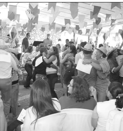
CONCURSO - Casais disputaram prêmios

Dezoito casais participaram do concurso de forró. O