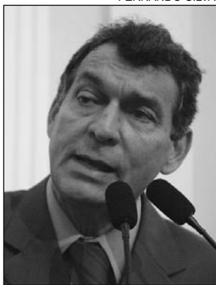
NÉLSON - Cobranças

As "dificuldades" enfrentadas pela Compesa voltaram a ser destacadas pelo deputado Nelson Pereira (PCdoB). A companhia de saneamento, de acordo com o parlamentar, vive um momento de instabilidade, agravado pela "justa" campanha salarial dos funcionários. "A Justiça do Trabalho decidiu multar a empresa em R$ 20 milhões por manter uma quantidade significativa de trabalhadores